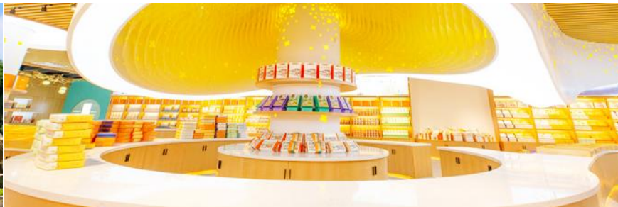
พิพิธภัณฑ์ดอกกุยฮวา