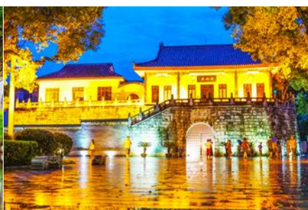
ประตูเมืองโบราณกุ๋หนานเหมิน