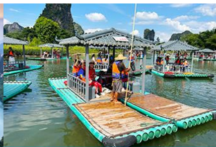
ขึ้นเรือแพชมม่านน้ำหลีเจียง