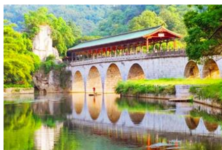
สวนเจ็ดดาว

พักที่ GUILIN VIENNA HOTEL ระดับ 4 ดาวท้องถิ่นหรือเทียบเท่าใน เมืองกุ้ยหลิน