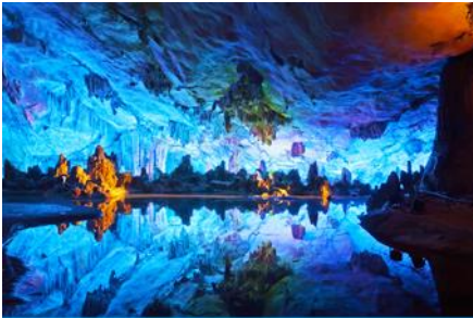
ถ้ำขลุ่ยอ้อ

พักที่ GUILIN VIENNA HOTEL โรงแรมระดับ 4 ดาวท้องถิ่น หรือเทียบเท่าในเมืองกุ้ยหลิน