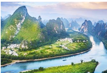
จุดชมวิวม่านน้ำหลีเจียงบนเขาเซียงกง

พักที่ GUILIN VIENNA HOTEL ระดับ 4 ดาวท้องถิ่นหรือเทียบเท่าใน เมืองกุ้ยหลิน