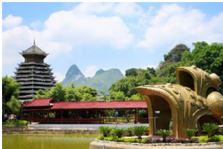
สวนหลิวซานเจีย