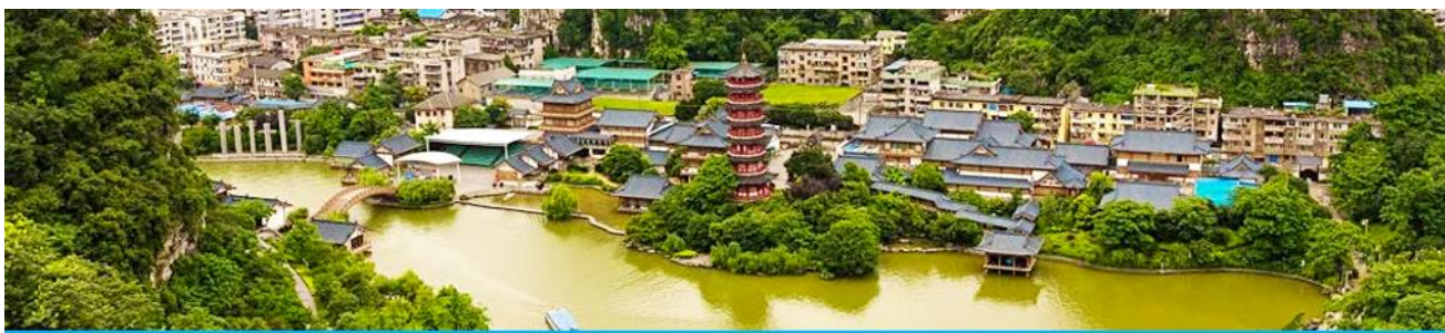
กุ้ยหลิน