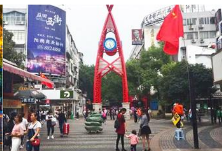
ถนนคนเดิน เจิ้งหยางลู่