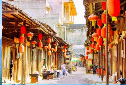
เมืองโบราณต้าชวี