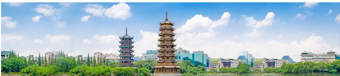
เจดีย์เงิน เจดีย์ทอง