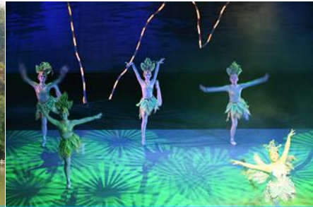
โชว์ DREAM LIKE LIJIANG