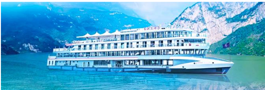
ล่องเรือชมเขื่อนสามผา