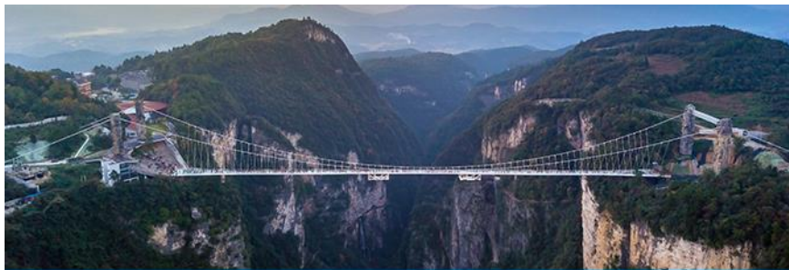
สะพานกระจกจางเจียเจี๋ย

อัตราค่าบริการสำหรับโปรแกรมเสริมการแสดงชุด The love Story of Wooden man and Fairy Fox ท่านละ 400 หยวน (หรือ 2,000 บาทขึ้นอยู่กับอัตราแลกเปลี่ยน) ระยะเวลาที่ใช้ในการเที่ยวชมการแสดง ประมาณ 3 ชั่วโมง รวมเวลาเดินทางไป กลับค่าบริการรวม ค่าบัตรเข้าชม ค่ารถรับ ส่ง และค่าน้ำทิพย์ของไกด์ท้องถิ่น พักที่ GUIYUANZHENPIN HOTEL โรงแรมระดับ 4 ดาวหรือเทียบเท่า