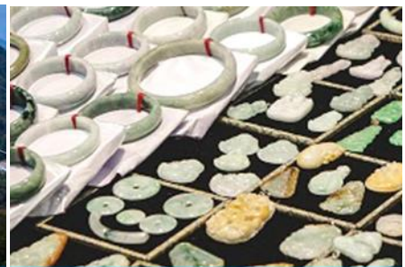
ศูนย์จำหน่ายผลิตภัณฑ์หยก

วันที่หก เมืองจางเจียเจี๋ย - เลือกซื้อโปรแกรมทัวร์เสริม(สะพานกระจกข้ามหุบเขาแกรนด์แคนยอน) – รับประทานอาหารค่ำที่ภัตตาคาร - ร้านใบชา – เดินทางกลับเมืองหยิงชัง