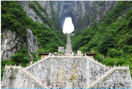
ประตูสวรรค์