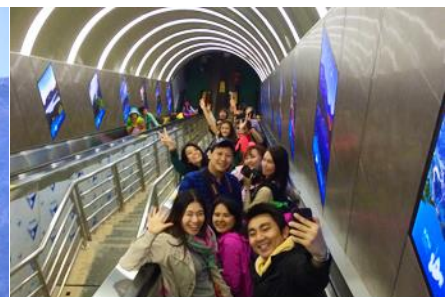
บันไดเลื่อนทะเลภูเขา

วันที่ห้า เมืองโบราณฟงหวง–เมืองจางเจียเจีย-ศูนย์ผลิตภัณฑ์ยางพารา– กระเช้าขึ้นเขาเทียนเหมินซาน ระเบียบแก้วเลียบนหน้าผา – บันไดเลื่อนทะเลภูเขา – (เลือกซื้อโปรแกรมเสริม โชว์ / จิ้งจอกขาว หรือ เมย์ลี่เซียงซี)