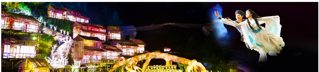
The Love Story of a Wooden Man and Fairy fox

** บันไดเลื่อนทะลุภูเขาจะปิดให้บริการในช่วงเดือนธันวาคม - เดือนกุมภาพันธ์ ของทุกปี. ด้วยเหตุผลด้านความปลอดภัย เนื่องจากเป็นช่วงที่มีหิมะปกคลุมในบางจุด และเส้นทางซึ่งทำให้ไม่สามารถใช้สัญจรได้ ในส่วนที่เป็นกระเช้าขึ้น/ลงเขายังคงเปิดให้บริการตามปกติในฤดูหนาว**