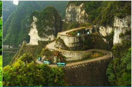
เส้นทาง 99 โค้ง

จากนั้นนำท่านสู่ โพรงประตูสวรรค์ 天门洞 โดย บันไดเลื่อนที่สร้างขึ้นโดยการเจาะทะลุภูเขา 穿山手扶梯 มีความสูงถึง 7 ชั้น เป็นสิ่งอำนวยความสะดวกใหม่ล่าสุดของ เขาเทียนเหมิน ซึ่งหาดูได้ยากตามแหล่งท่องเที่ยวต่างๆ ทั่วโลก บริเวณนี้ ท่านจะได้ถ่ายภาพ ประตูสวรรค์ อย่างใกล้ชิด โดยในปี 1990 มีนักบินผาดโผนชาวรัสเซียขับเครื่องบิน 3 ลำบินลอดผ่านช่องโพรงหินประตูสวรรค์แห่งนี้พร้อมกัน ภาพประวัติศาสตร์นี้ถูกบันทึกและเผยแพร่ไปทั่วโลก ภูเขาเทียนเหมินซานจึงเป็นที่รู้จักของนักผจญภัยทั่วโลกที่อยากเดินทางมาสัมผัสด้วยตัวเอง.... จากนั้นท่านสามารถทดสอบกำลังขาของท่านโดยการเดินลงบันได 999 ขั้น เพื่อลงมายังลานกว้างที่เป็นจุดถ่ายรูปด้านล่างของประตูสวรรค์ ท่านที่ไม่ต้องการเดินบันไดลง สามารถใช้บันไดเลื่อนแทนการเดินลงบันได 999 ขั้น ณ ลานกว้างด้านล่างเป็นจุดถ่ายรูปที่ดีที่สุดที่สามารถมองเห็นเขาประตูสวรรค์ได้อย่างชัดเจน จากนั้นนำท่านนั่งกระเช้าลงจากเขาเทียนเหมินซาน