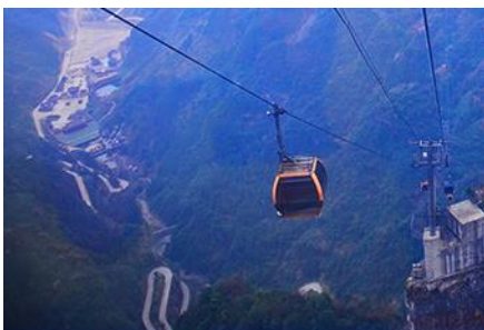
กระเช้าขึ้นเทียนเหมินซาน

โรงแรมระดับ 4 ดาวท้องถิ่นหรือเทียบเท่าในเมืองฟงหวง