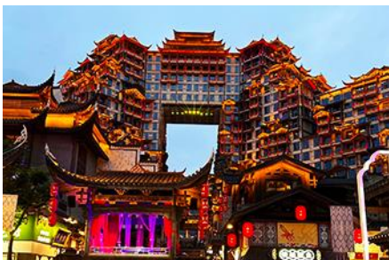
ตึกมหิศวรรษย์ 72 ชั้น

พักที่ YICHANG MELJI BOYUE HOTEL โรงแรมระดับ 4 ดาวหรือเทียบเท่าในเมืองหยี่ซัง