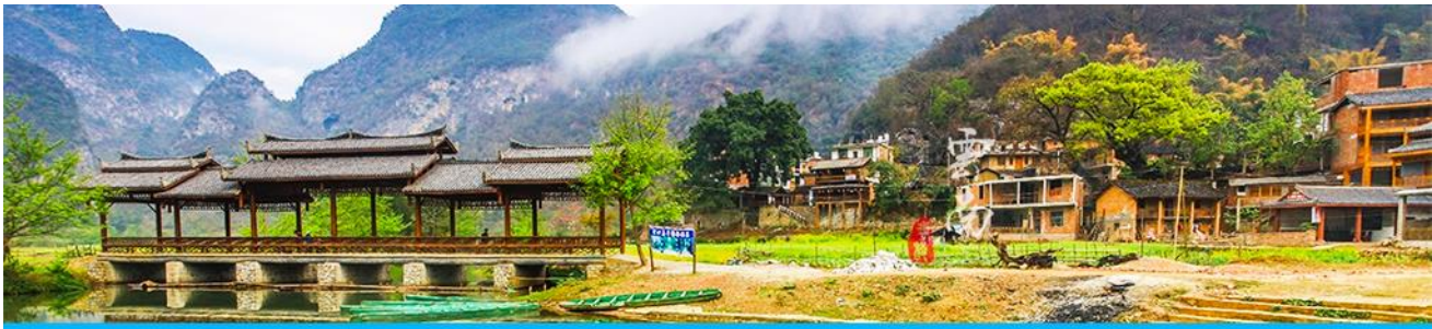
สวนดอกท้อ