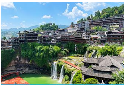
เมืองโบราณฝูหรงเจิ้น

https://hk.trip.com/hotels/guzhang-hotel-detail-68614854/chaxitai-holiday-hotel/