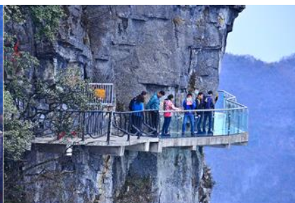
หน้าพลาวยฟ้าทางเดินกระจก