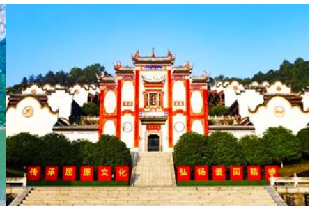
บ้านเกิดกวี ชวีหยวน