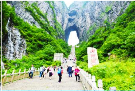
บันได 999 ขั้น