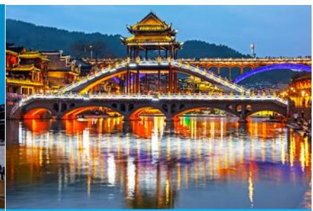
สะพานหวงเจียว