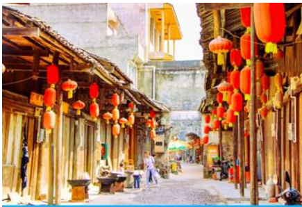
เมืองโบราณต้าชวี