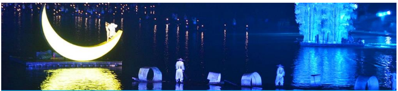
The Impression of Liu Shan Jie

หลังอาหารเช้าท่านเดินทางเข้าที่พัก หรือท่านสามารถเลือกซื้อโปรแกรมเสริม เป็นบัตรชมการแสดง ชุด The Impression of Liu shan jie หรือที่เรียกกันในหมู่นักท่องเที่ยวไทยว่า โชว์แม่น้ำ เป็นการแสดงบนแม่น้ำหลีเจียง