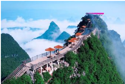
นั่งกระเช้าขึ้นเขาหฺรูอี้ฟง

พักที่ YANGSHUO ELITE HTL OR KEY CARD HTL ระดับ 4 ดาวท้องถิ่นหรือเทียบเท่าในเมืองหยางซั่ว