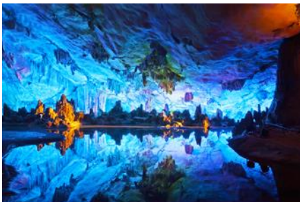
ถ้ำขลุ่ยอ้อ

พักที่ GUILIN VIENNA HOTEL โรงแรมระดับ 4 ดาวท้องถิ่น หรือเทียบเท่าในเมืองกุ้ยหลิน