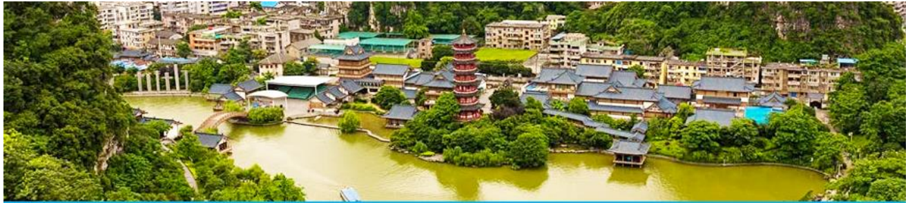
กุ้ยหลิน

-ไม่เก็บทิปก่อนเที่ยว เพราะมันใจในคุณภาพ