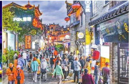
ย่าน ตงซีเซียง

วันที่สี่ เมืองหยางซั่ว – ภูเขาหฺรูอี้ฟง – เมืองกุ้ยหลิน – ศูนย์แพทย์แผนจีน- หอเซียวเหยาไหลว – ซ้อปี้งย่าน ตงซีเซียง ออฟชั่น ไคด์ขาย เทียวเมืองลับแล