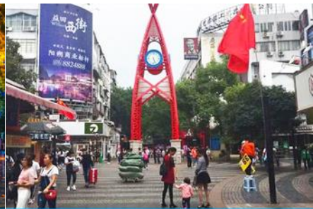
ถนนคนเดิน เจิ้งหยางลู่