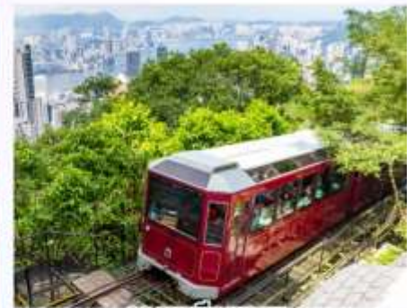
รถรางพิกแนม