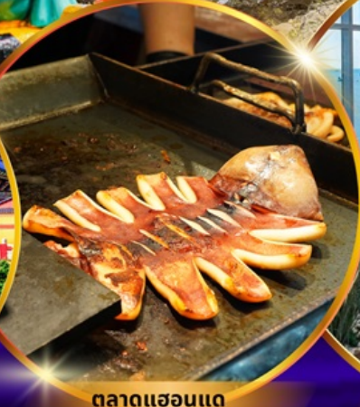
ตลาดแฮอนแด