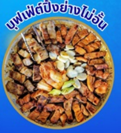
บุฟเฟ่ต์ปิ้งย่างไม่อั้น