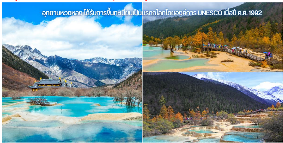
อุทยานหวงหลง ได้รับการขึ้นทะเบียนเป็นมรดกโลกโดยองค์การ UNESCO เมื่อปี ค.ศ. 1992

URGENT! เส้นทางนี้...เดินทางสู่พื้นที่สูงมากกว่า 2,500 เมตรจากระดับน้ำทะเล เนื่องจากมีความดันอากาศและออกซิเจนลดลง อาจจะทำให้เกิดอาการแพ้ที่ราบสูงได้ หากมีอาการกรุณารีบแจ้งไกด์หรือหัวหน้าทัวร์