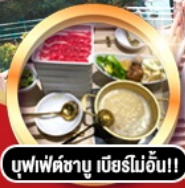
บุฟเฟ่ต์ชาบู เภียรไม่อัน!!