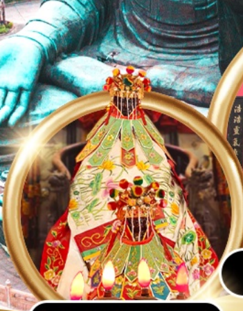
เยี่ยมเงินเจ้าแม่กวนอิมสองห้า