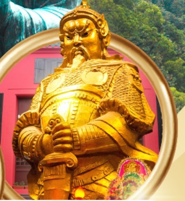
วัดเขangkหมิว