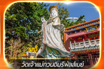
วัดเจ้าแม่ทวนอิมพรอสเปอริตี

รวมตั๋วดิสนีย์แลนด์+รถรับ-ส่ง ซอปปิงแบบจัดเต็ม พักย่านจิมซาจุ่ย