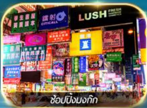
ช้อปปิ้งมงก๊ก

เต็มอิ่มทั้งบุญ และ ช้อปปิ้งแบบจัดเต็ม จิมซาจุ่ย มงก๊ก