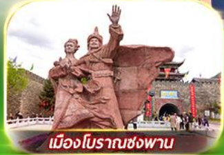
เมืองโบราณซ่งพาน