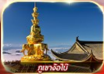
กุเขาจ้อไบ๊