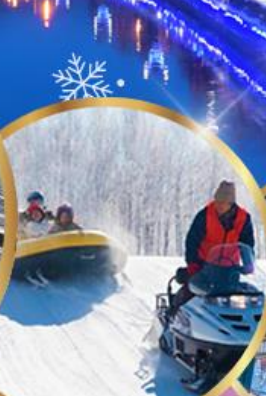
ซึทึโซ สโนว์แลนด์