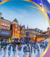
โรงงานช็อคโกแลต ชิโรอิ โคอิมีโตะ