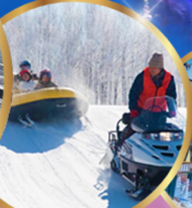
ซิกิไซ สโนว์แลนด์