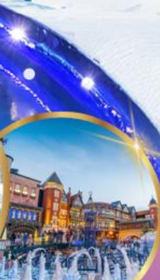
โรงงานช็อคโกแลต ชิโรอิ โคอิมีโตะ

ราคา เริ่มต้น 36,919 บาท รวมภาษีมูลค่าเพิ่ม 7%