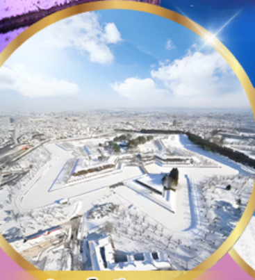
ป้อมโทเรียวคาคุ