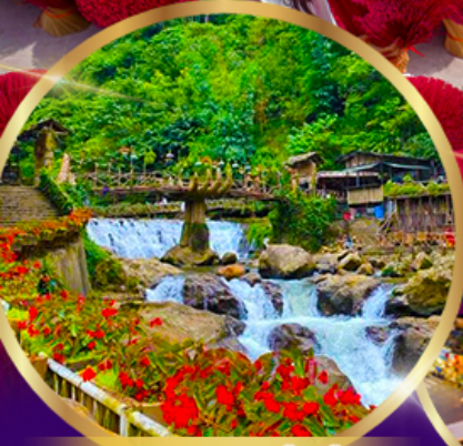
หมู่บ้านชาวเขา ก๊ต ก๊ต