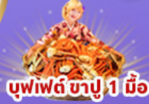
บุฟเฟต์ ซาปู 1 มือ

45,919 ราคา เที่ยว รวมภาษีมูลค่าเพิ่ม 7%