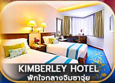
KIMBERLEY HOTEL พักใจกลางอิมซาจุ๋ย