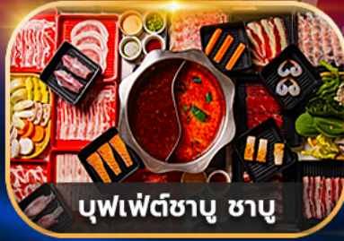
บุฟเฟ่ต์ชาบู ชาบู