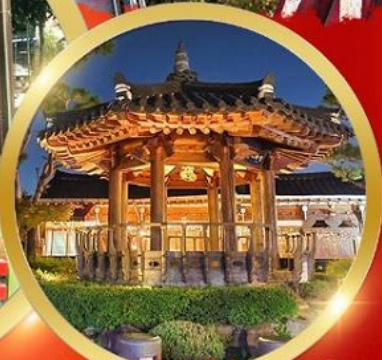
Jeonju Hanok Village