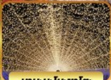
บอบะนะโนะซาโตะ