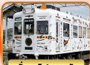
นั่งรถไฟทามะวัง