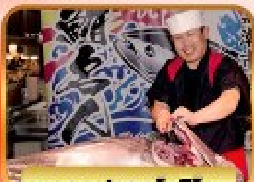
ตลาดปลาคุโรชิโอะ