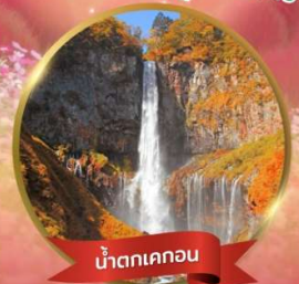
น้ำตกเคคอน