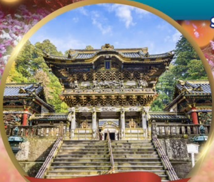
ศาลเจ้านิกโก โทโฮกุ