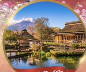
หมู่บ้านโอชิโนะฮักไก