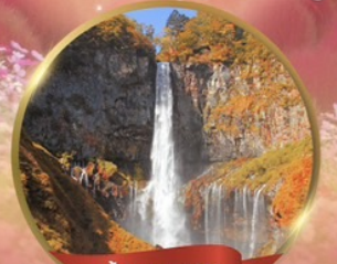
น้ำตกเคคอน