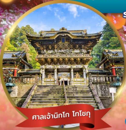
ศาลเจ้านิกโก โทโชกุ