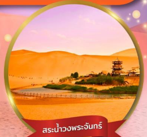
สระน้ำวงพระจันทร์