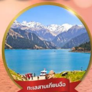
ทะเลสาบเทียนจื่อ