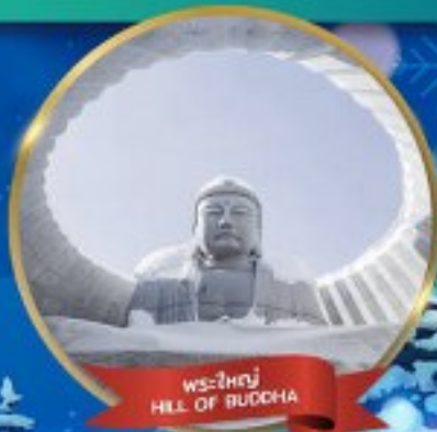
พระใหญ่ HILL OF BUDDHA