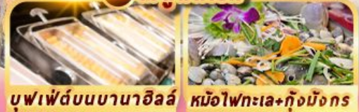
บุฟเฟ่ต์บนบานาฮิลล์ หม้อไฟทะเล+กุ้งมังกร