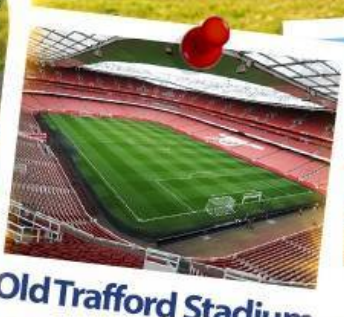
Old Trafford Stadium