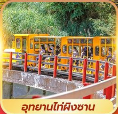
อุทยานไท่ผิงซาน