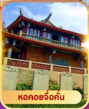
หอคอยจ้อคั่น