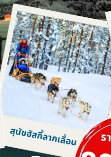
สุนัขฮัสกีลากเลื่อน