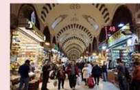
ตลาดสไปซ์มาร์เกต

** พักที่ TAKSIM GONEN HOTEL 4* หรือเทียบเท่า **