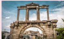
ชุ่มประตฺยูเคเรียน

** พักที่ B BUSINESS HTOEL 5* หรือเทียบเท่า **