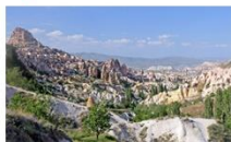
หมู่บ้านของนกพิราบ

** พักที่ DEDELI CAVE HOTEL 5* หรือเทียบเท่า **