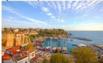
อันตาเลีย