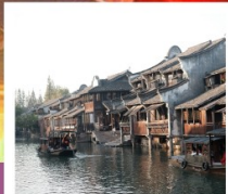
เมืองโบราณผานหลงกู่เจิน