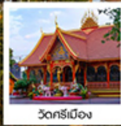
วัดศรีเมือง