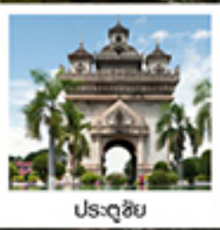
ประตูชัย