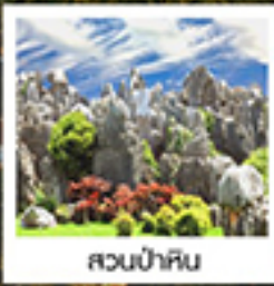
สวนป่าหิน