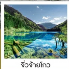
จั๋วจ้ายโกว