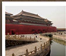
พระราชวังปักกิ่ง