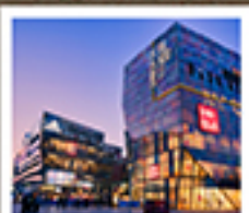
ย่านซานหลี่ตุ๋น