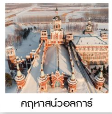
คฤหาสน์วอลการ์