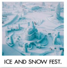
ICE AND SNOW FEST.

คฤหาสน์วอลการ์ (ฟรีเล่น Snow Tubing) โบสถ์เซนต์นิโคลัส / มู่ตันเจียง / ชมแสงสีกลางคืนถนนสายยูนิเจีย เขาแกะหิมะ / เขาป้างดูย / ภาพเขียนสี ICE AND SNOW โบสถ์เซินโซเฟีย / เกาะพระอาทิตย์ / เทศกาลแกะสลักน้ำแข็ง