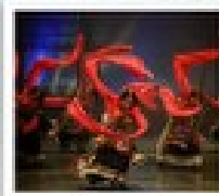
โรว์ฟิเบต