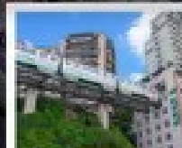
ตึกไม่ลงถ้ำ

ทัวร์คุณภาพ ไม่ลงร้านฮ้อปปีง • ไม่ขายออฟชั่น