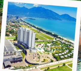
Mikazuki Japanese Resorts & Spa