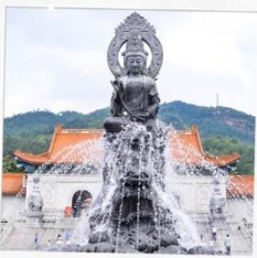
วัดพุทโธ