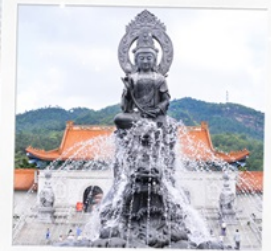
วัดพุทโธ