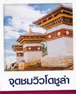
จุดชมวิวโตซูล่า