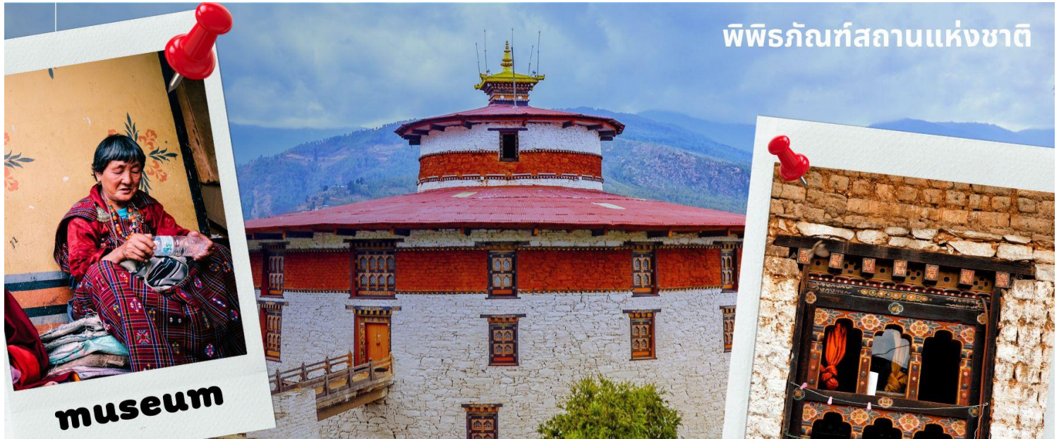
พิพิธภัณฑ์สถานแห่งชาติ

เที่ยง รับประทานอาหารเที่ยง ณ ภัตตาคาร (มื้อที่ 1)