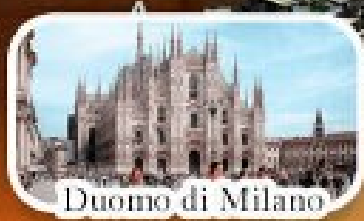
Duomo di Milano