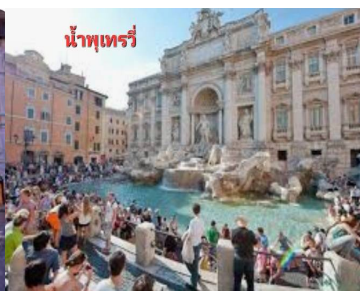
น้ำพุเทร่