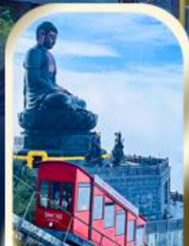
เลือกซื้อทัวร์เสริม ชั้นยอดซาฟานซิปิน