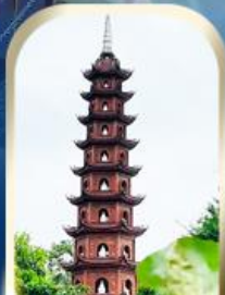
ไหว้พระ:ขอพร ชมเจดีย์พันปีเงินทิวัก