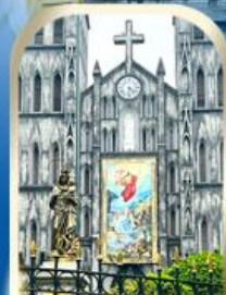
เช็กอินฮานอย โบสถ์เซนต์โจเซฟ