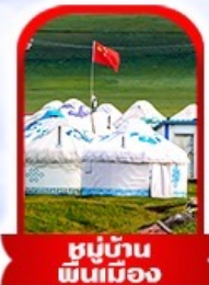
หมู่บ้าน พื้นเมือง