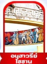
อนุสาวรีย์ โซซาน