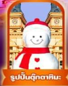
รูปปั้นตุ๊กตาหิมะ

เที่ยวฟิน 7 วัน 5 คืน ธันวาคม 67 - กุมภาพันธ์ 68