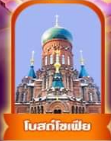
โบสถ์โซเฟีย