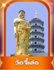
วัดจี๋เล่อ