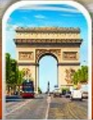
ARC DE TRIOMPHE FRANCE