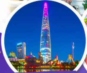
ตึกจ็อดเต็มจลล์