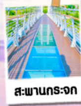
สะพานกระจก