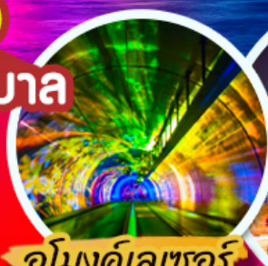
อุโมงค์เลเซอร์