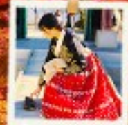
ใส่ชุดฮันบก