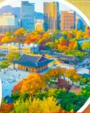
พระราชวังเคียงอกซุกง