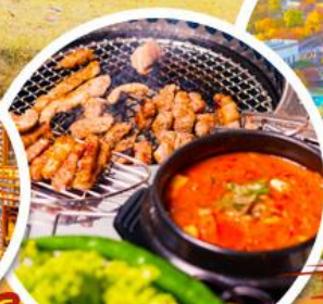
หมูย่างเกาหลี