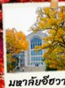
มหาวิทยาลัยช็องวา