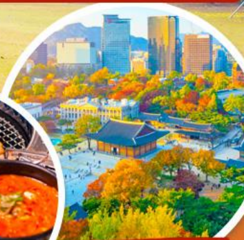
พระราชวังถึงอกชุกุง