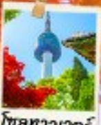
โซลทาวเวอร์