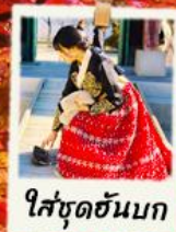
ใส่ชุดฮันบก