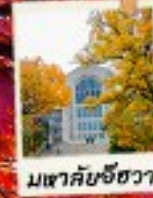
มเขาคัยชีฮวา