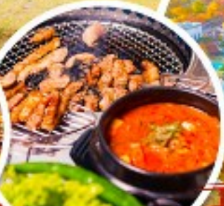
ตัวอย่างเกาหลี