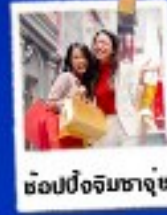
ช้อปปิ้งจิมซาจุ๊ซ