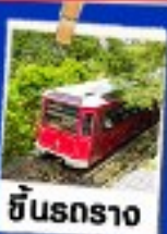
ซินรถราง