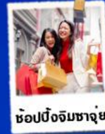
ซ้อปซิ่งจิมซาจ๋ย