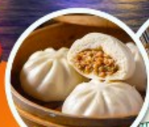
ติ่มซำฮ่องกง