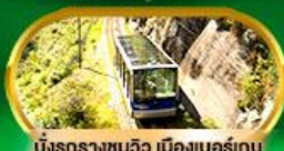
นั่งรถรางชมวิว เมืองเบอร์เกน