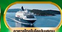
อาหารไทยในโคเปนเฮเกน